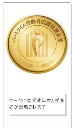
マークには受賞年度と受賞名が記載されます

まずは、「パート労働者活躍企業診断サイト」で自社の取組状況を診断して下さい。 次に、「パート労働者活躍企業宣言サイト」で自社の取組内容を宣言して下さい。 最後に、「パート労働者活躍推進企業表彰サイト」の所定様式にて応募して下さい。 ※上記サイトは全て「パート労働ポータルサイト( http://part-tanjikan.mhlw.go.jp/ )」内にあります。