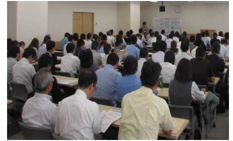
6月7日 沼津商工会議所で行われた説明会の様子